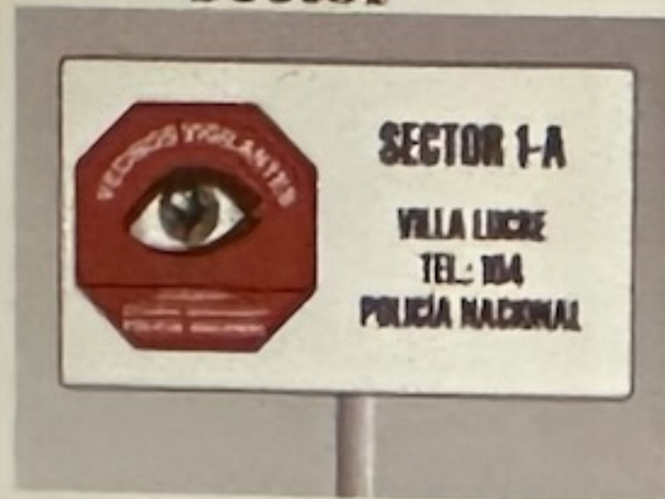
Letreros de sector