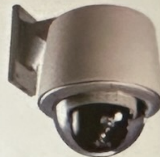
Cámara Digital (opcional)